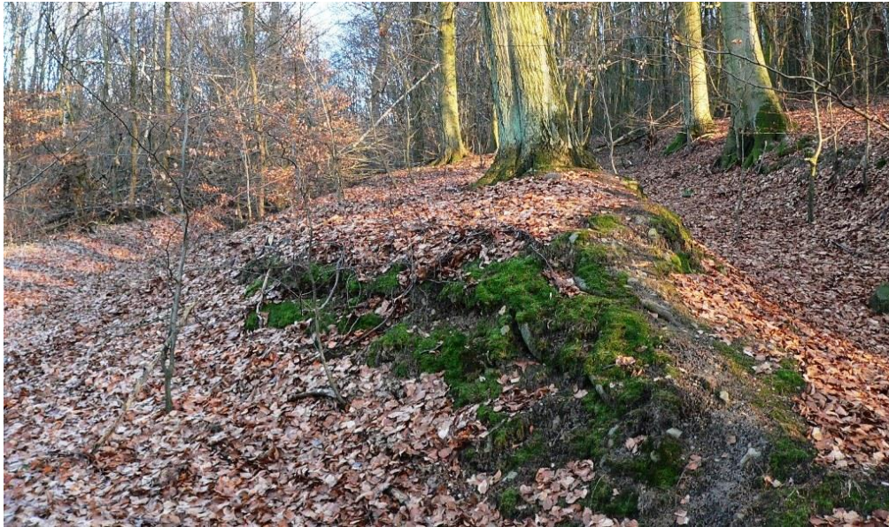
Deutlich zu erkennende historische Hohlwege