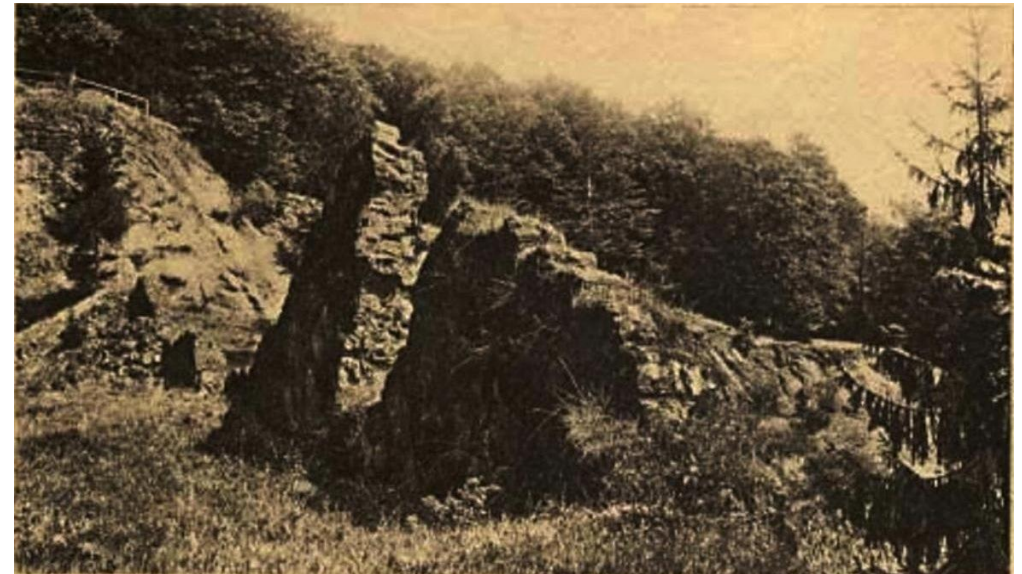
Teufelsmauer – Postkartenmotiv von 1911 Heute ist hier alles mit Bäumen zugewachsen

Stillegung lt. Literatur 1928 bzw. 1932, lt. Zeitzeugen aber Anfang 1950-er noch in Betrieb. Dies ist durch ein Foto belegbar.