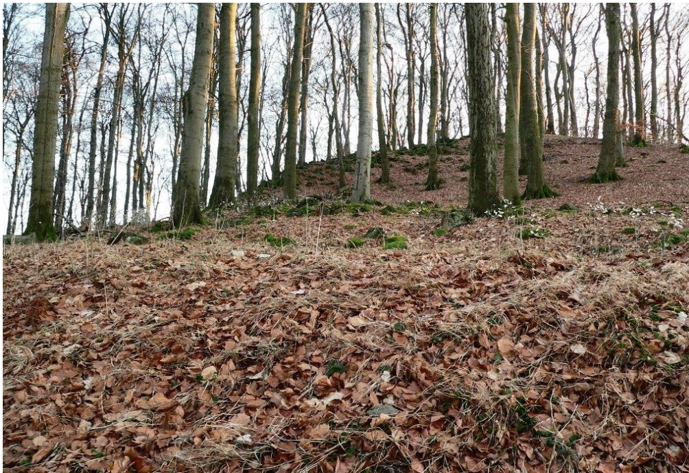
Ringwallreste am Hirzstein

Auf den Spuren der Kulturen – 19.07.14 – 14:00 (14:30)